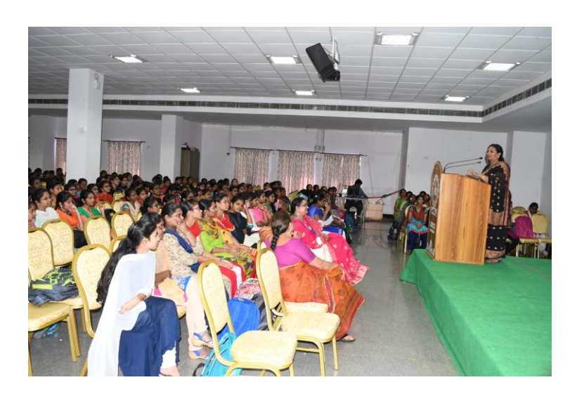
Speech by Resource Person