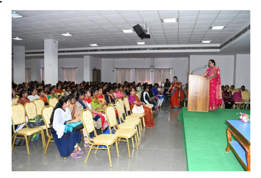
Welcome Speech by Presiding Officer