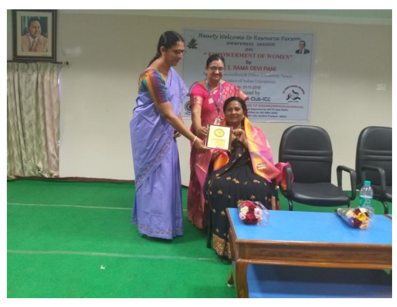
Felicitation of Resource person